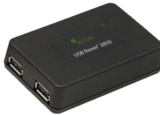
リモートユニット