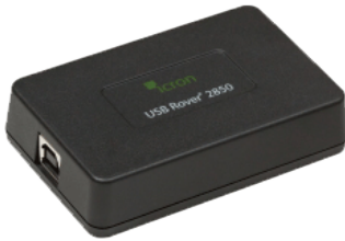
ローカルユニット

Icron Technologies は、USB エクステンダーのリーディングカンパニーです。医療・工業・商業・教育・放送などの分野で多くのご採用実績があります。