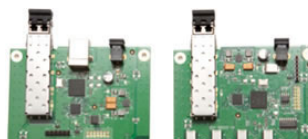
*USB Ranger 2224 の内部ボードです