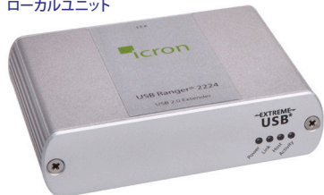
ローカルユニット

Icron Technologiesは、USBエクステンダーのリーディングカンパニーです。医療・工業・商業・教育・放送などの分野で多くのご採用実績があります。組込み用のボード・モジュール販売も承ります。