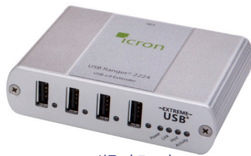
リモートユニット