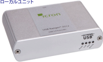
ローカルユニット