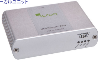
ローカルユニット

Icron Technologiesは、USBエクステンダーのリーディングカンパニーです。医療・工業・商業・教育・放送などの分野で多くのご採用実績があります。組込み用のボード・モジュール販売も承ります。