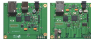
・USB Ranger 2201 の内部ボードです