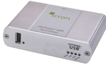
リモートユニット